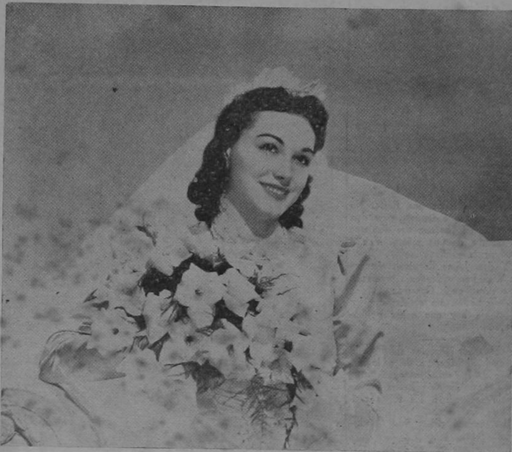
Esta encantadora novia de Georgia, dice:

"De los Jabones que he usado me agrada el CAMAY como el mejor de todos".